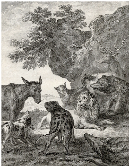
LES ANIMAUX MALADES DE LA PESTE. Fable CXXV.