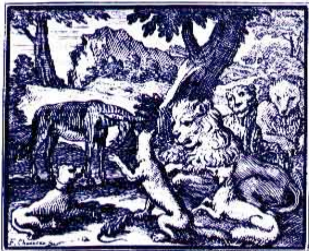
CHAUVEAU XVIIe s. Les Animaux malades de la peste (BNF, Paris)