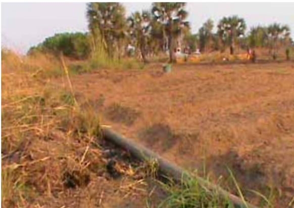
■ Conduite de pétrole à l'air libre sur un coteau érodé devant une maison sur une route à la sortie de Muanda. Juin 2013.