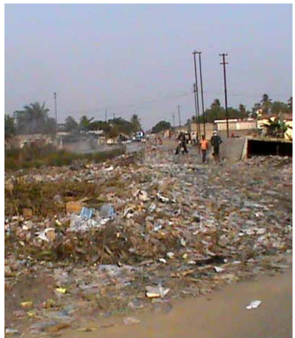
■ Une rue dans le centre de Muanda, juin 2013. L'amoncellement des ordures ménagères illustre à la fois l'absence d'intervention publique et le peu de portée de l'action de « l'ONG » Bunkete (qui veut dire propreté), soutenue par Perenco Rep 35 et censée veiller à la propreté publique.

La ville incarne finalement les limites de la pensée magique « brut = développement ». Si comme le dit Perenco, « le pétrole reste une aventure », pour les habitants il est signe d'une gabegie tragique.