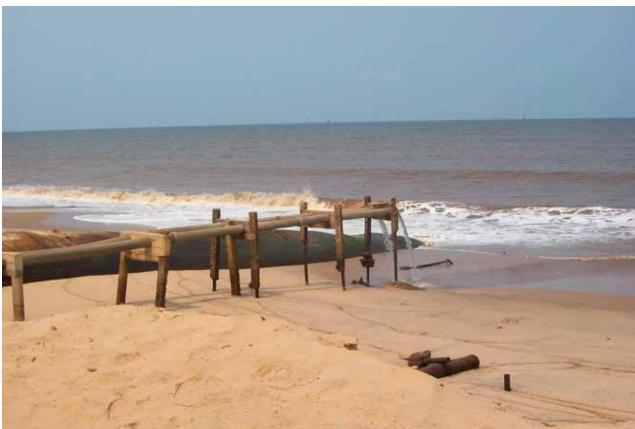
■ Disposal waste à East Mibale ( Terminal de Perenco Rep. ) près du village Kongo. Date inconnue.

Le cas des villages du groupement Kongo (voir encadré ci-après) est connu par les autorités locales, et les villageois qui se sont pacifiquement mobilisés ont été traités comme des criminels. Malgré leur protestation et la mobilisation d'organisations congolaises de la société civile, on ne sait pas si le gouvernement ou la compagnie ont effectué une étude d'impacts du rejet des eaux de formation sur la pêche, la qualité de l'eau ou encore sur la santé des populations.