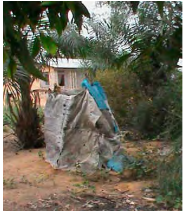
■ Point d'eau au cœur de la cité. La majorité des habitants puise l'eau dans des puits communs qui plongent dans une nappe peu profonde et dont la qualité n'est pas assurée. Juin 2013.