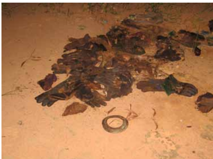
■ Gants souillés de brut abandonnés par des ouvriers près du village de Liawenda. Mars 2011.

Les populations ne sont pas en capacité de détecter (si ce n'est en la consommant et donc en tombant malade) quels types de polluants se retrouvent dans l'eau et n'ont pas accès à l'information en amont de la part de l'entreprise ou des autorités locales. Si on soupçonne une contamination du système hydrique, le gouvernement doit agir afin d'assurer que des sources alternatives d'eau propre soient mises en place. Or, celui-ci n'a pas effectué les analyses pouvant déterminer les volumes des polluants ayant pu contaminer le système hydrique de la zone, ou encore leurs impacts sur l'eau, la pêche ou la santé des populations. Le contrôle et l'accès à l'information sur le niveau de contamination est pourtant primordial car ils peuvent démontrer si les normes internationales en la matière sont respectées ou pas.