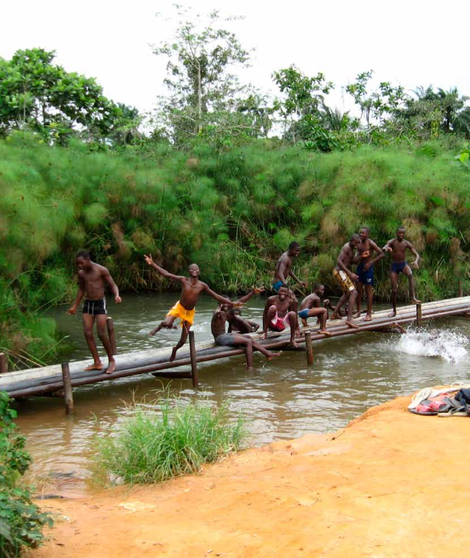
■ Enfants plongeants dans la rivière depuis des tuyaux transportant du pétrole. Mars 2011.