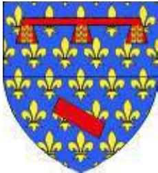
Aubigny-en-Artois (cité, 62)